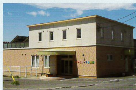
ドリームキッズ保育園