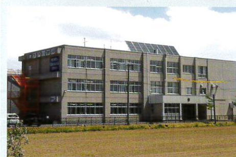
札幌市立茨戸小学校