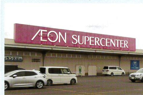
イオンスーパーセンター 石狩緑苑台店