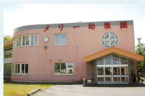
茨戸メリー幼稚園