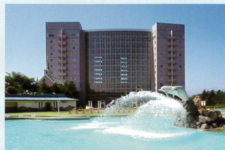
シャトレーゼ ガトーキングダム・サッポロ