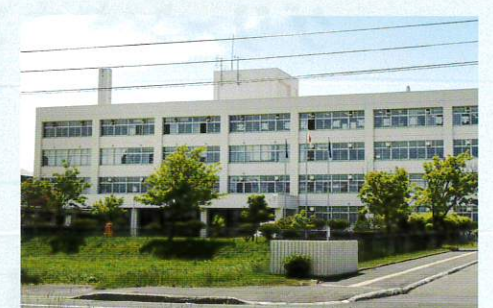
北海道立英藍高等学校