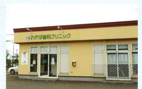
わかば歯科クリニック