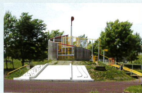
拓北いきいき公園