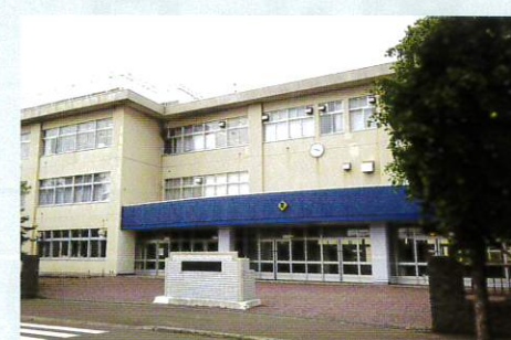
札幌市立篠路西中学校